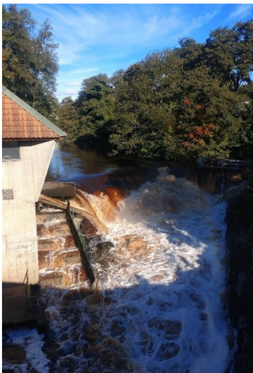
Bobergs Kraftstation 2024-09-29