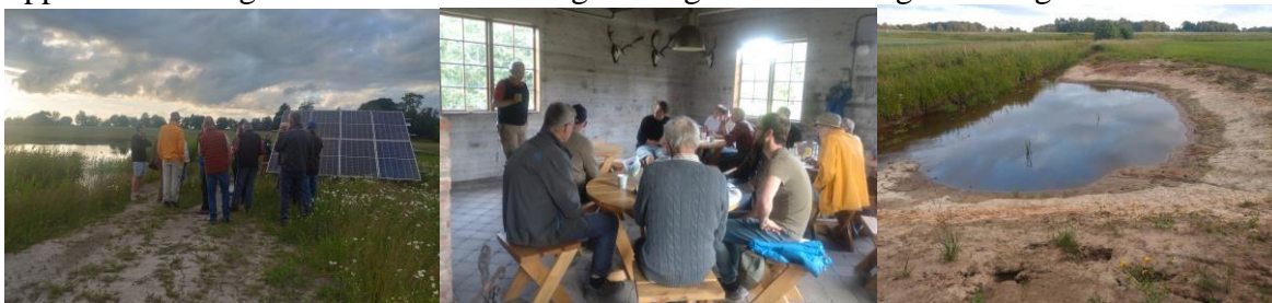
Sommarkväll i Sannarpsåns avrinningsområde 18 juni 2024

Under året har Suseåns sänkingsföretag rensat sträckan Slöinge- Getinge och planerar rensa uppströms Getinge under 2025. Sänkingsföretaget har ett 4 årigt rensningstillstånd.