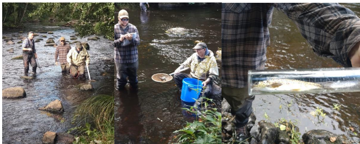
Elfiske i Suseån med Fiskeklubben Laxen den 31 aug 2024.

Den 31 aug genomfördes elfiske tillsammans med fiskeklubben Laxen i Boberg. Årets elfiske visade på mycket bra reproduktion. Resultatet blev 32 ålar, 60 smålaxar, 5 elritsa och 2 öringar. Under året har det utförts restaureringsarbeten för att återställa brister i fiskvägar på en sträcka i Hovgårdsån. Hovgårdsån är ett biflöde till Suseån uppströms Knobesholm.